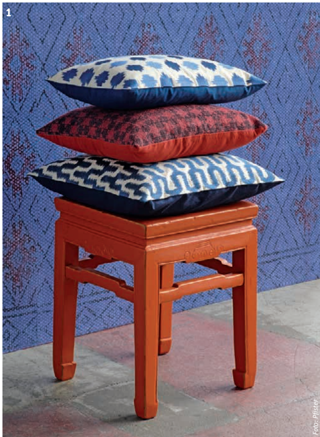
Foto gross) Farbige Wände können Atmosphäre schaffen und einen Wohnraum völlig verändern.

1) Geschickt kombinierte Accessoires machen aus jeder Wohnung ein ganz individuelles Zuhause.